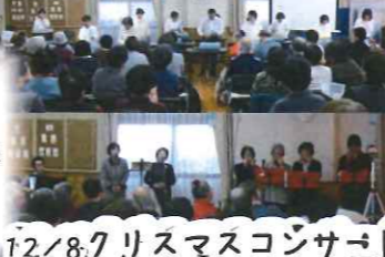
12/8クリスマスコンサート