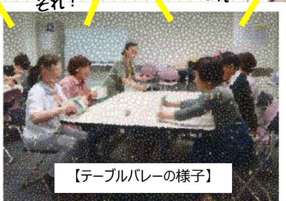
【テーブルバレーの様子】