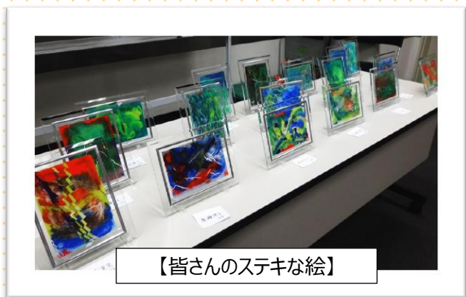
【皆さんのステキな絵】

独自のアートプログラムに沿って創作活動を行うことにより脳が活性化し、認知症の症状が改善されることを目的として開発されました。医療・美術・福祉の壁を越えたアプローチが特徴で、アートセラピーの先進国にも例を見ない先駆的な取り組みと言えます。