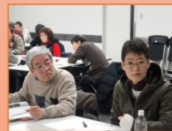
平成27年度市民後見人候補者名簿登録者研修の様子