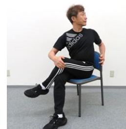
脚を組み、上の脚の方に上体をひねる。(左右各10秒~)