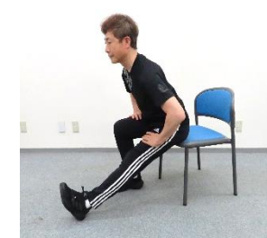
片脚を前に伸ばし、上体を腰から前に倒す。(左右各10秒~)