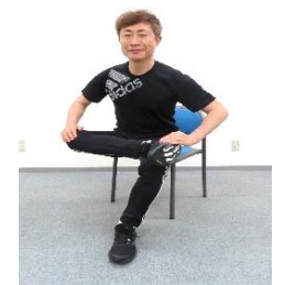
片足を反対の膝にのせ、上体を前に倒す。(左右各10秒~)