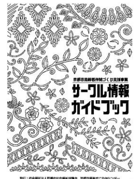
↑サークル情報ガイドブック 2年に1回発行しています。