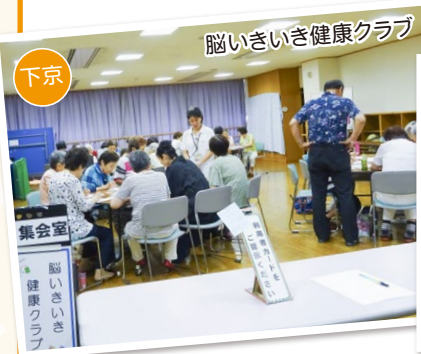
脳いきいき健康クラブ