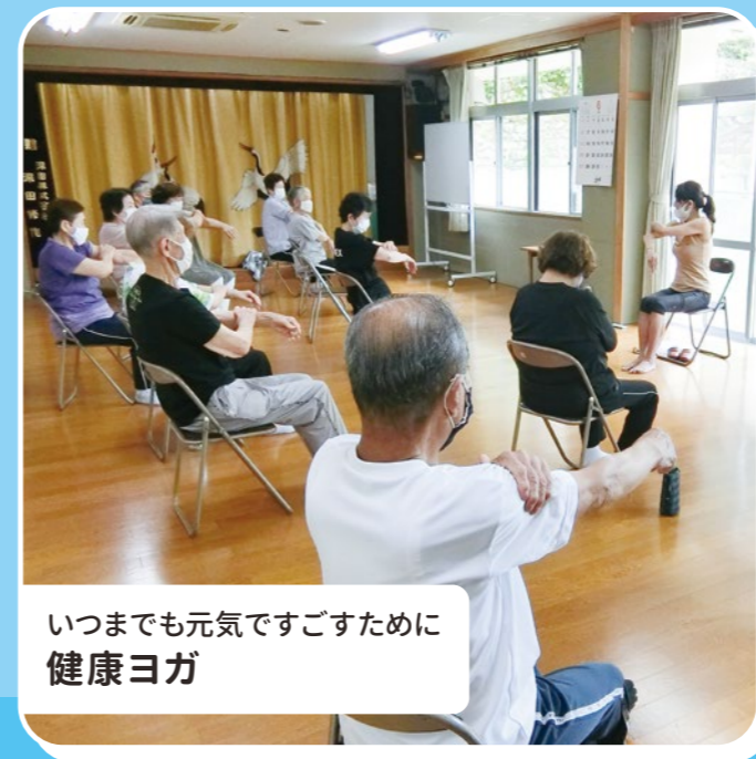
いつまでも元気ですごすために 健康ヨガ