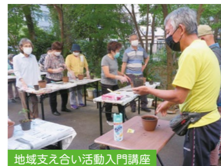
地域支え合い活動入門講座