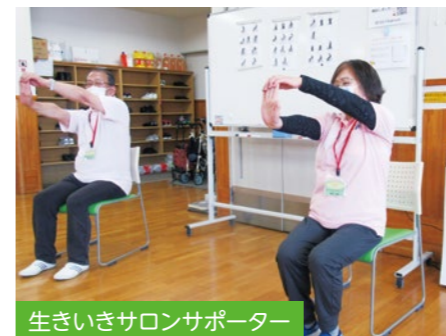
生きいきサロンサポーター