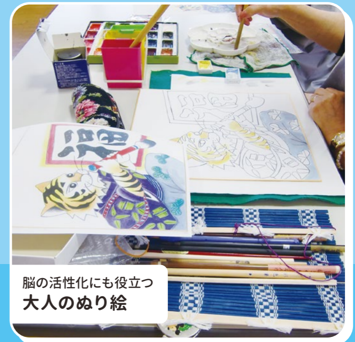
脳の活性化にも役立つ 大人のぬり絵